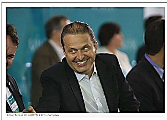
Figura 2 – Imagem da notícia do DP